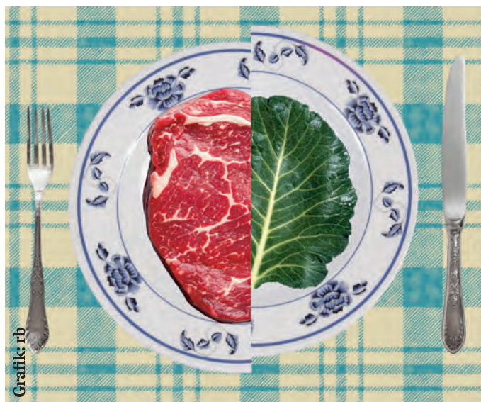
Fisch, Fleisch, Tofu oder doch das Schweineschnitzel aus Seitan?

Auch in der Gastronomie macht sich die flexitarische Ernährung bemerkbar: Im August vergangenen Jahres gab das Drei-Sterne-Restaurant „Eleven Madison Park“ in New York bekannt, nach vier Jahren veganer Cuisine wieder Fleisch zu servieren. In Leipzig setzen die Sterneküchen auf vegetarische Optionen: Im „kuultivo“ werden Muscheln mit Schwarzwur-