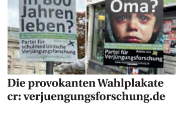
Die provokanten Wahlplakate