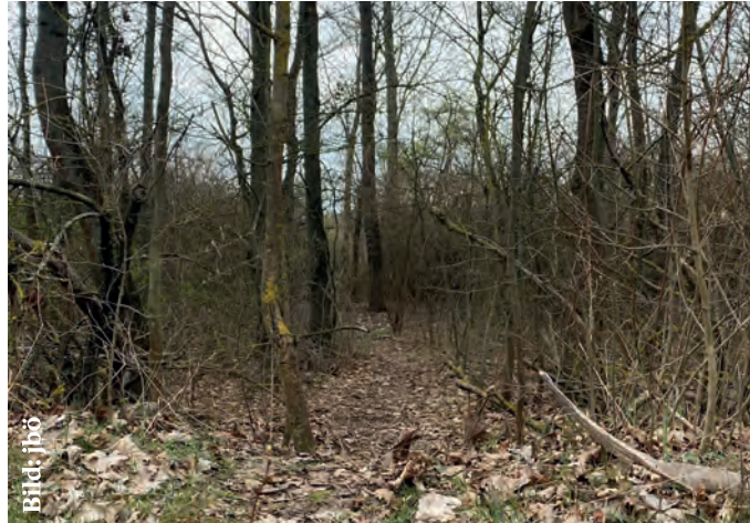
Das Waldstück am Roten Berg bei Erfurt

In Erfurt traf der Pestausbruch in das Narrativ eines Schreckensjahrhunderts: Die Chronik der Stadt verzeichnet eine Hungersnot, der 1315/16 mehrere Tausend Einwohner*innen zum Opfer fielen. Wie die FAZ berichtete, war die Magdalenenflut im Jahr 1342 für etwa ein Drittel der Bodenerosion des vergangenen Jahrtausends verantwortlich. Im Jahr 1349 verübte die christliche Bevölkerung infolge des Einzuges der Pest in der Stadt ein Pogrom, bei dem etwa 1.000 Menschen jüdischen Glau-