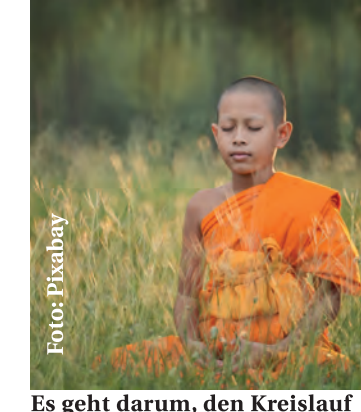
Es geht darum, den Kreislauf zu durchbrechen. Das Ziel ist dabei die Erlösung im spirituellen Weg.