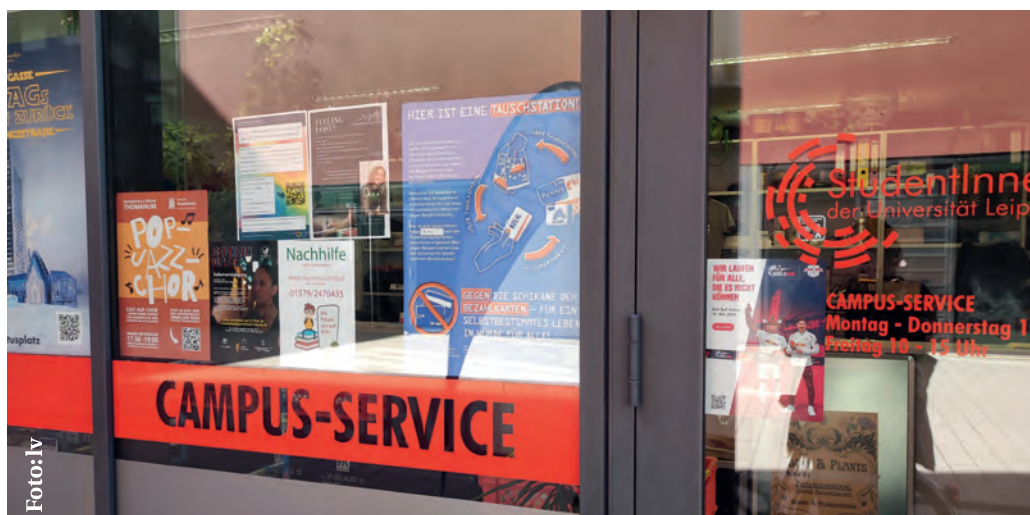
Tauschstation am Campus-Service

Seit Mai 2024 wird in Deutschland schrittweise die sogenannte Bezahlkarte für Asylbewerber*innen eingeführt. Geflüchtete erhalten ihre Sozialleistungen größtenteils über diese Karte, eine Art guthabenbasierte Debitkarte, die jedoch mehrere Einschränkungen mit sich bringt. Bargeldabhebungen sind auf maximal 50 Euro im Monat begrenzt. Überweisungen und Online-Zahlungen sind je nach Bundesland stark eingeschränkt oder gar nicht möglich. In Sachsen sind Überweisungen – zumindest innerhalb von Deutschland – teilweise möglich, müssen jedoch einzeln gerechtfertigt werden. Online-Käufe sind ebenfalls