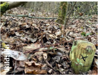
Das X markiert die Stelle.

Ein interdisziplinäres Forschungsteam der Universität