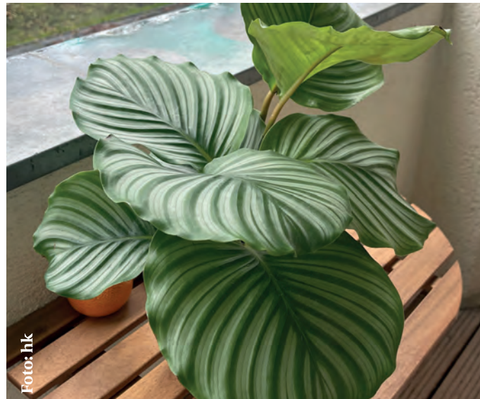
Abgebildet ist eine Calathea

Aber unabhängig von der jeweiligen Art gibt es einige Grundregeln der Pflanzenpflege. Beim Gießen gilt: lieber seltener, dafür durchdringend wässern. Das verhindert Stauwasser und fördert ein gesundes Wurzelwachstum. Ob eine Pflanze Wasser benötigt, lässt sich einfach testen: Fühlt sich die Erde in ein bis zwei Zentimetern Tiefe trocken an, ist es Zeit zu gießen. Einige Arten, etwa Orchideen, bevorzugen statt klassischem Gießen ein kurzes Tränken, indem man sie im Übertopf für einige Minuten in Wasser stellt. Dabei bitte nicht vergessen, den Übertopf zu leeren, sonst wird die Pflanze