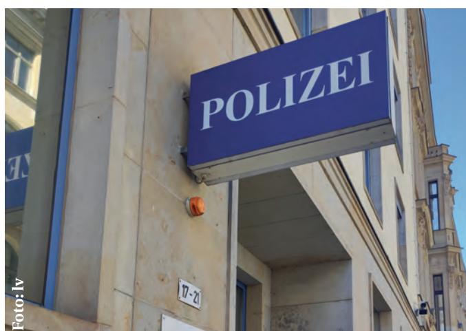
Sachsens Polizei soll bald mehr Befugnisse erhalten.