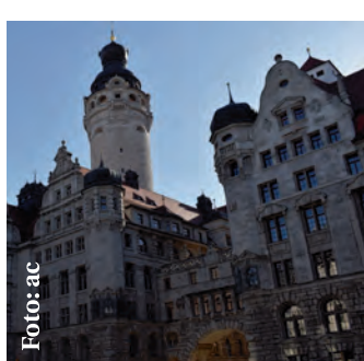
Die Charta wurde im Mai 2025 beschlossen.