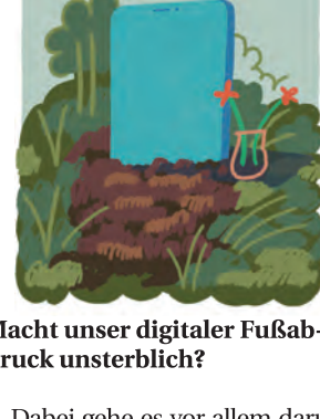
Macht unser digitaler Fußabdruck unsterblich?

über den Tod hinaus ermöglichen. Eines der Unternehmen, das diese Technik anwendet, nennt sich „You, Only Virtual“: Mit wenigen Daten wie Textnachrichten und Sprachaufnahmen können Kund*innen eine „Versona“ ihrer Angehörigen erstellen, die Charakter, Sprechweise und Stimme bestmöglich nachbildet.