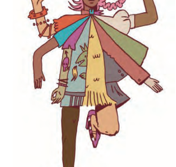
Im hinduistischen Glauben bleibt nach dem Tod die Seele erhalten – nur der Körper vollzieht eine Veränderung.

Seele bleibe konstant, weshalb eine Person trotz körperlicher Veränderungen im Laufe des Lebens die gleiche Identität empfinde. „Der Tod ist dabei einfach ein Übergang, kein Ende“, betont Petrovic. Was nach einer guten Sache klingt, ist im hinduistischen Glauben mehr eine Strafe. Der Kreislauf Samsara ist die immer wiederkehrende Reinkarnation in einen neuen Körper, das Ziel der Existenz ist aber die Moksha, die Erlösung der Seele von Begierden und damit auch die Freiheit, nicht mehr wiedergeboren werden zu müssen.