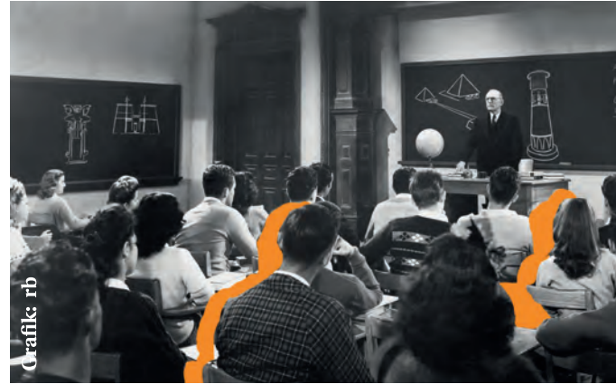
Von Dresscode bis Finanzierung – Erstakademiker*innen erleben den Studienstart oft anders.