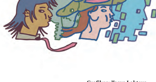
Grafiken: Tasya Lokteva

Gibt es ein Leben nach dem Tod? Zumindest in vielen Religionen. Doch der Mensch versucht auf andere Weise, ewig zu leben.