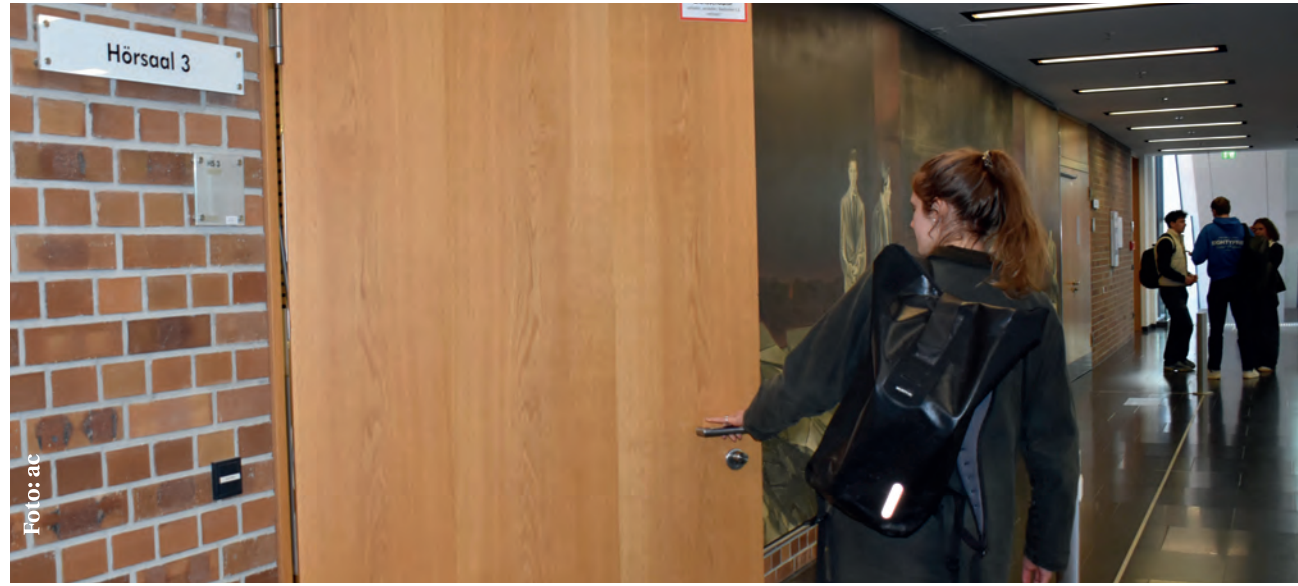
Am zwölften November 2025 wurde ein Professor der Universität Leipzig gegenüber einer*in Studierenden handgreiflich. Die Universität gibt keine Auskunft darüber, ob infolge dessen ein Disziplinarverfahren gegen ihn eingeleitet wurde. (Symbolbild)

Aus der Pressestelle von Widersetzen auf Bundesebene war zu entnehmen, dass die Leipziger Ortsgruppe „in engem Kontakt zum Fachschaftsrat (FSR) Soziologie, Stu-