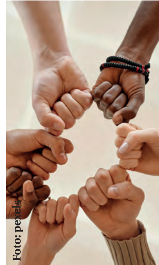
Gemeinschaftlicher Zusammenhalt ist wichtig.

Betroffene im Zentrum Wichtig sei, sich nicht in den Vordergrund zu stellen, sondern